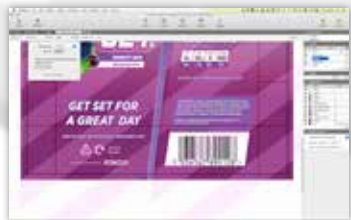
Informacje o obiektach grupy przedstawiane są w formie graficznej

ArtPro+ to edytor natywnych plików PDF do obsługi procesu przygotowania opakowań do druku. ArtPro+ umożliwia bezpośrednią pracę z plikami PDF przy użyciu rozbudowanego zestawu narzędzi edycyjnych, służących przygotowywaniu grafiki do druku.