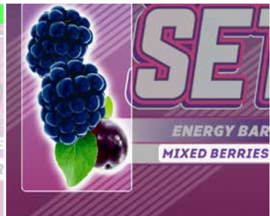
Kontrola jakości przygotowywania do druku