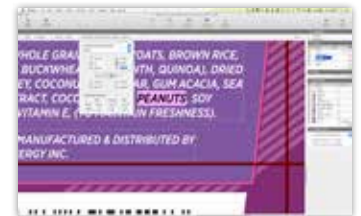
Ramki tekstowe są rozpoznawane automatycznie, aby umożliwić zmianę przepływu tekstu podczas pisania