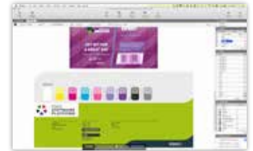
Narzędzia Dynamic Marks generują automatycznie table i panele informacyjne zlecenia

ArtPro+ umożliwia stosowanie rastrowania obiektowego w celu podniesienia jakości druku. Obsługiwane są zarówno znormalizowane pliki PDF, jak i nowe przychodzące pliki PDF. ArtPro+ oferuje rozszerzony zestaw narzędzi opartych na rodzajach rastra Imaging Engine i niestandardowych kształtach punktów rastrowych. Unikalny widok zastosowanych rastrow pozwala przyspieszyć kontrolę jakości rastrowania.